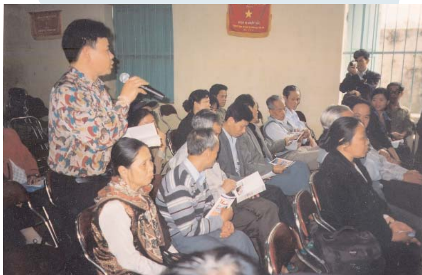
Một buổi sinh hoạt chi hội nông dân không thuốc lá

Định kỳ phối hợp với chính quyền địa phương, các tổ chức xã hội khác và lãnh đạo chi hội không thuốc lá, thuốc lào đánh giá tình hình thực hiện các hoạt động và cam kết của các hội viên; Kêu gọi nguồn lực từ địa phương để động viên kịp thời các hội viên có thành tích và duy trì các hoạt động của mô hình; Tổng hợp báo cáo hoạt động của các chi Hội không thuốc lá , thuốc lào gửi chính quyền địa phương và Hội nông dân cấp quận/ huyện.